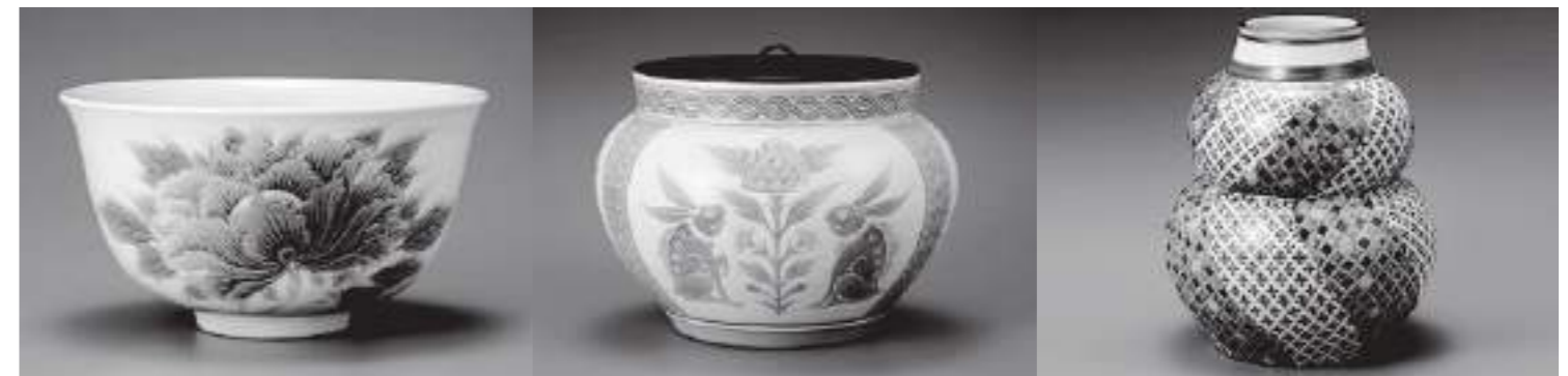
板谷 波山 茶碗牡丹文