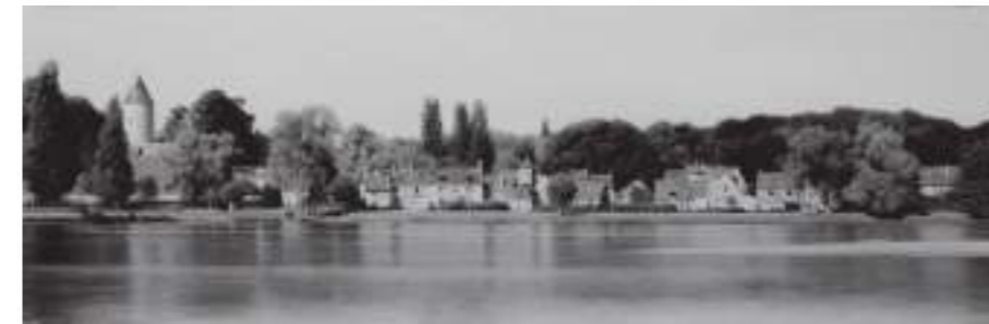
森本草介《アリエー川の流れ》2013年