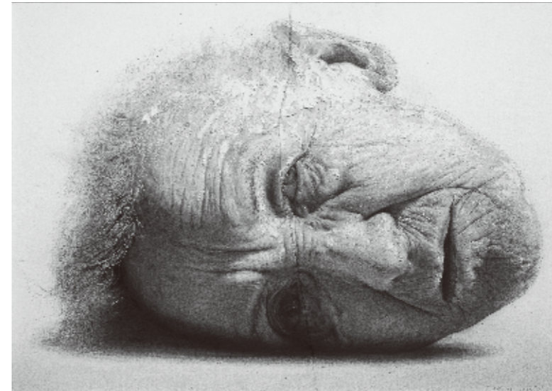
ゴルチョ《眠らない肖像》2007年

主催：ホキ美術館 後援：外務省、スペイン大使館、インスティトゥト・セルバンテス東京